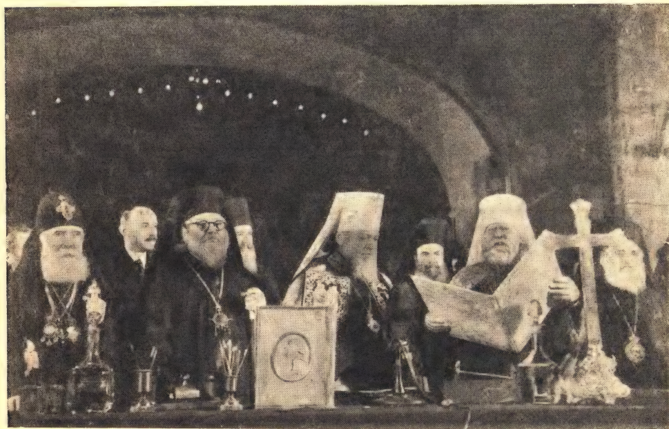
Митрополит Николай читает грамоту об избрании Митрополита Алексия Патриархом Московским и всея Руси

«Теперь остается еще имя Патриаршего Местоблюстителя Митрополита Ленинградского и Новгородского Высокопреосвященнейшего Алексия».